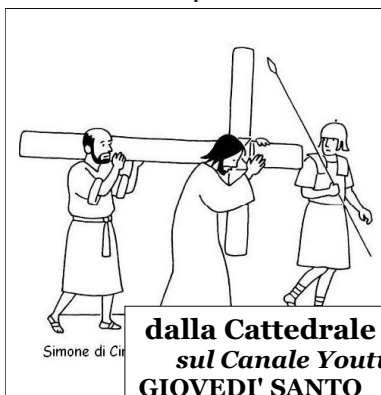
Simone di Ci