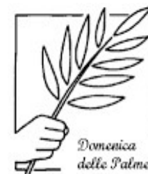
Domenica delle Palme

"per sapere chi sia Dio devo solo inginocchiarmi ai piedi della Croce" (K. Rahner). (Padre Ermes Ronchi)