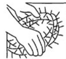
Venerdì di passione