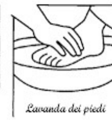
Lavanda dei piedi